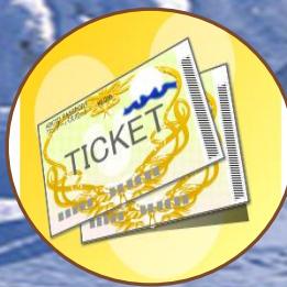
免费代购预订门票