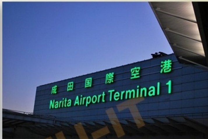
成田空港 第1旅客ターミナル おりば:4階、のりば・チケットカウンター:1階