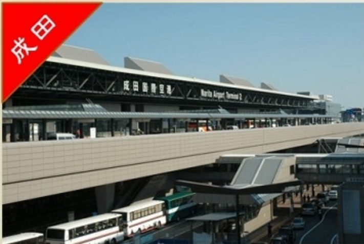
成田空港 第2旅客ターミナル おりば:3階、のりば・チケットカウンター:1階